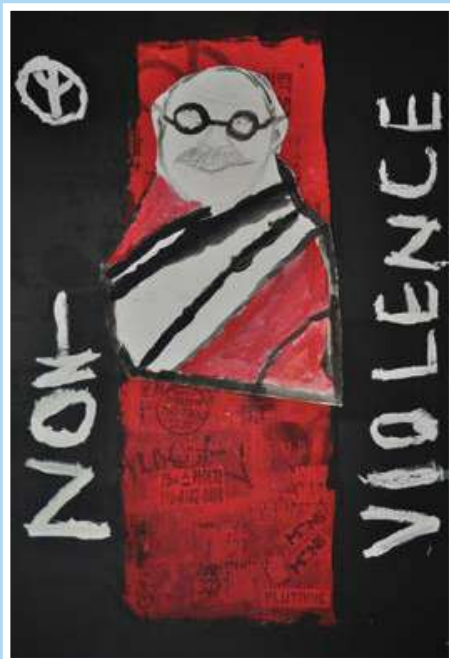
Αθανάσιος Χατζής και Δημήτρης Τσαγκογιάννης Ζωγράφειο Γυμνάσιο