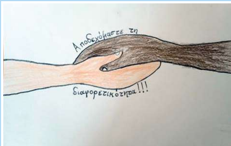
Ακριβή Παπαδημητρίου 5 ο Δημοτικό Σπάρτης