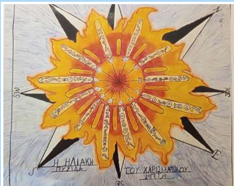
Νικολέτα Αργυράκη 3 ο Δημοτικό Αλίμου