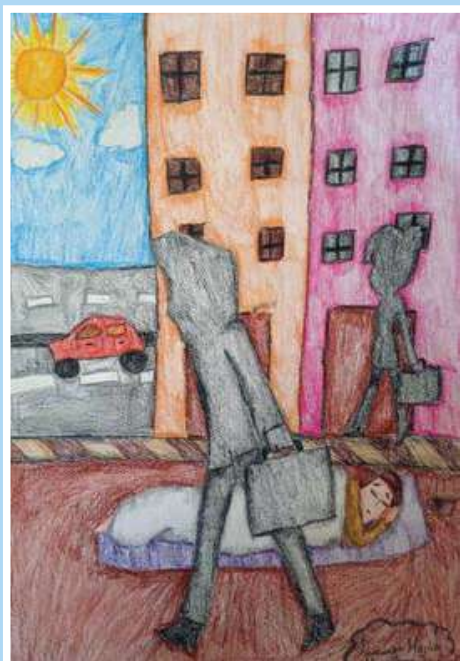
Ιωάννα Μαρία Μιχαλοπούλου 5 ο Δημοτικό Σπάρτης