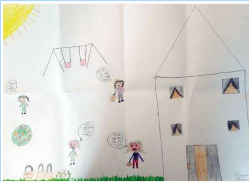
Αλεξάνδρα Σωτηροπούλου 28 ο Δημοτικό Πειραιά