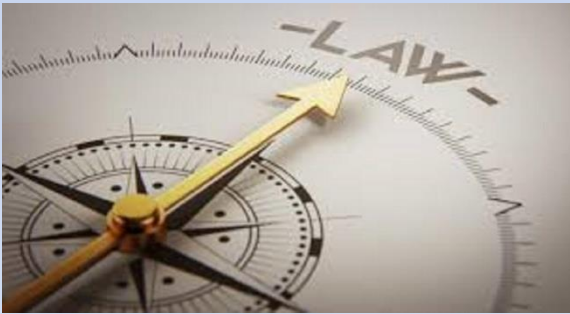
Θεσμικό πλαίσιο και ανάλυσή του