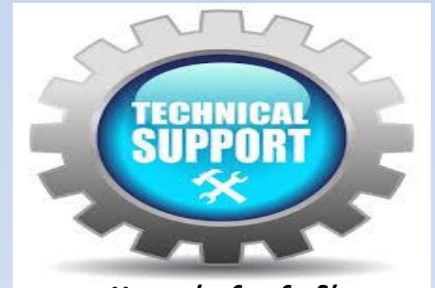
Υποστήριξη εξειδίκευση ειδικών θεμάτων