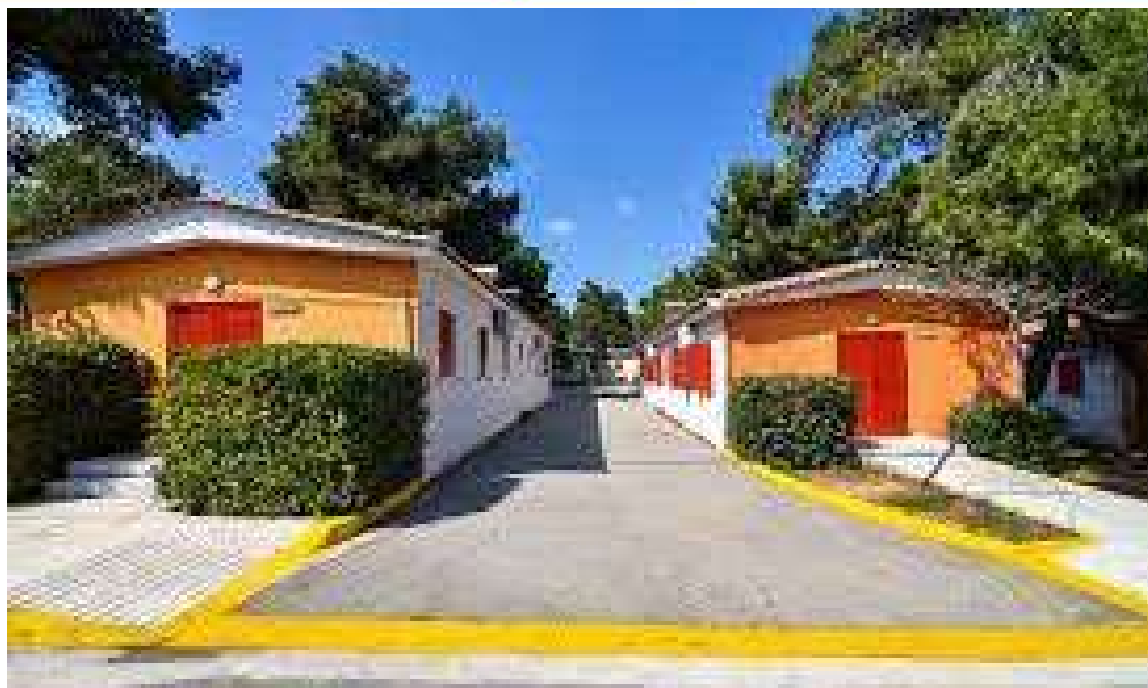
Λειτουργία Παιδικών Εξοχών - Κατασκηνώσεων