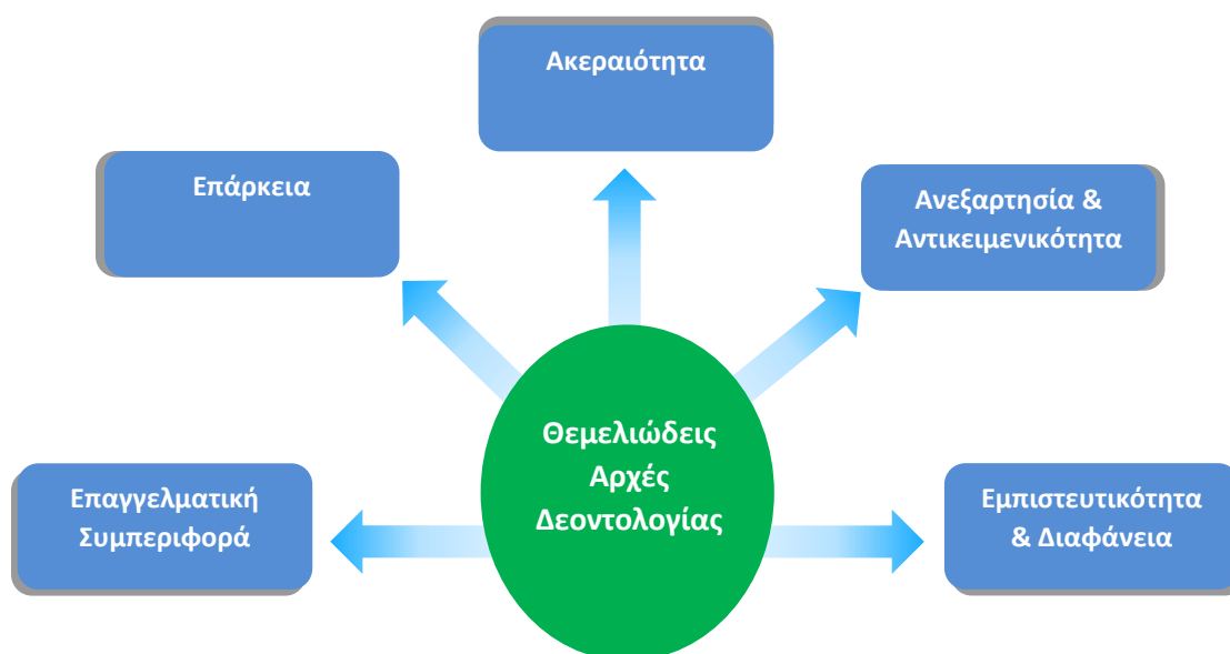
Γράφημα 2: Θεμελιώδεις Αρχές Δεοντολογίας για τους Επιθεωρητές-Ελεγκτές της Ε.Α.Δ.