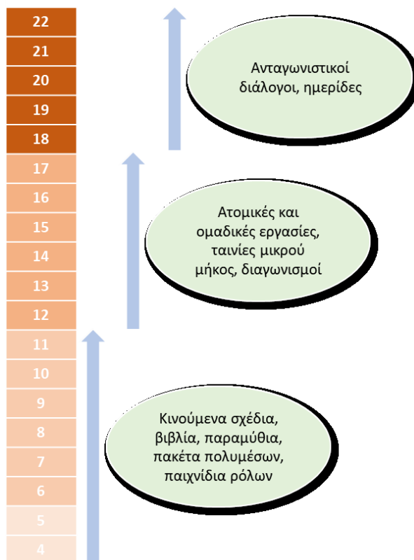
Εικόνα 1: Εκπαιδευτική Προσέγγιση με βάση την Ηλικία

Λίγο πριν την ενηλικίωση, ο έφηβος έχει αρχίσει να ανεξαρτητοποιείται, εφαρμόζοντας λογικούς κανόνες, συνεργάζεται με τους άλλους, ανταλλάσσει απόψεις και καθίσταται ικανός να κρίνει και να βγάλει συμπεράσματα. Στο στάδιο αυτό, τα παιδιά αφενός, αντιλαμβάνονται πλέον ότι, υπάρχουν κανόνες που συμβάλλουν στην αρμονική συνύπαρξη των ανθρώπων και αφετέρου αναπτύσσουν τους δικούς του ηθικούς κανόνες σε σχέση με θέματα όπως η δικαιοσύνη, η ισότητα, η ελευθερία και τα ανθρώπινα δικαιώματα, βάσει των οποίων διαμορφώνουν και τον τρόπο συμπεριφοράς τους (υπεράσπιση, αποδοκιμασία).