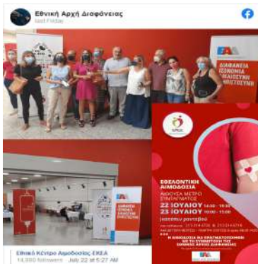
Εθελοντική Αιμοδοσία ΕΚΕΑ - Ε.Α.Δ. - ΜΕΤΡΟ Συντάγματος