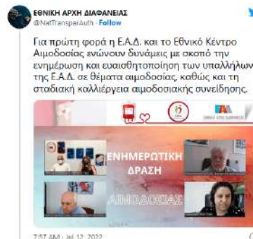
Ε.Α.Δ. και Εθνικό Κέντρο Αιμοδοσίας ενώνουν δυνάμεις για την ενημέρωση & ευσαιθητοποίηση των υπαλλήλων της Ε.Α.Δ. σε θέματα αιμοδοσίας