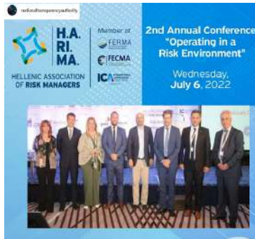
Ε.Α.Δ. - H.A.R.I.M.A.: 2nd ANNUAL CONFERENCE - Operating in a Risk Environment