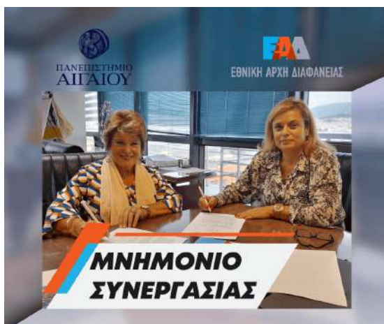
ΜΝΗΜΟΝΙΟ ΣΥΝΕΡΓΑΣΙΑΣ Ε.Α.Δ. - ΠΑΝΕΠΙΣΤΗΜΙΟ ΑΙΓΑΙΟΥ