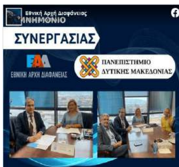
Μνημόνιο Συνεργασίας Ε.Α.Δ. - Πανεπιστήμιο Δυτικής Μακεδονίας