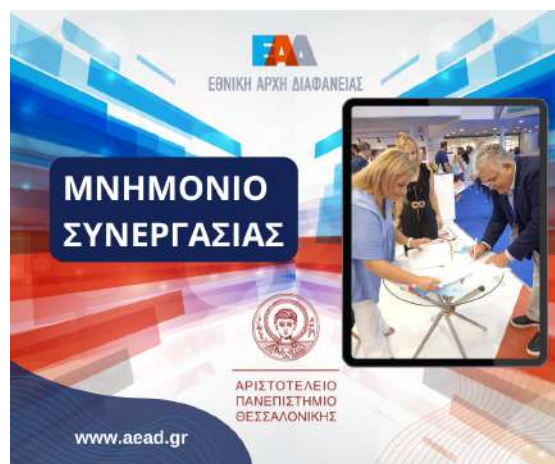
ΜΝΗΜΟΝΙΟ ΣΥΝΕΡΓΑΣΙΑΣ Ε.Α.Δ. - ΑΡΙΣΤΟΤΕΛΕΙΟ ΠΑΝΕΠΙΣΤΗΜΙΟ