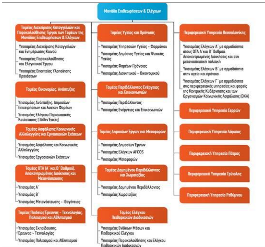
1. Οργανόγραμμα Μονάδας Επιθεωρήσεων & Ελέγχων της ΕΑΔ

Κύριο μέλημα της ΜΕΕ αποτελεί ο εντοπισμός φαινομένων διαφθοράς των φορέων που εμπíπτουν στο πεδίο εφαρμογής του ελεγκτικού έργου της Αρχής, όπως αυτό προσδιορίζεται στο άρθρο 83 παρ.1 του Ν.4622/2019. Επιπρόσθετα, βασική της αποστολή αποτελεί η διασφάλιση της εύρυθμης και αποτελεσματικής λειτουργίας και ο εντοπισμός φαινομένων